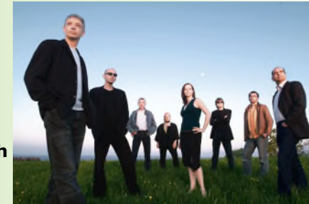
Jam As United

Wir feiern Fasching mit Jam as United - das sind vier grandiose Black Voices, die unter die Haut gehen, eine funkige Rhythm-Section, Percussion, Bläser und ein abendfüllendes, niemals langatmiges Programm. Musik zum Tanzen, Grooven, Mitsingen und sich Wohlfühlen. In den Pausen werden Goetz und Matches weiter für Stimmung sorgen.