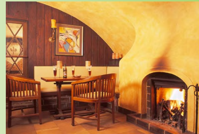
Die Sisi-Bar im Golfhotel Kaiserin Elisabeth